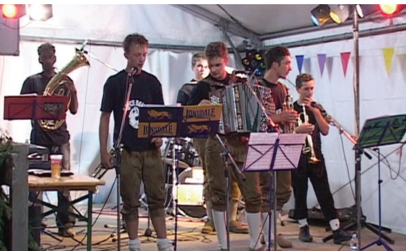
»Opica band« prvokrat igra za ples na odprtju žegna v petek zvečer, 21. 7. 2006.