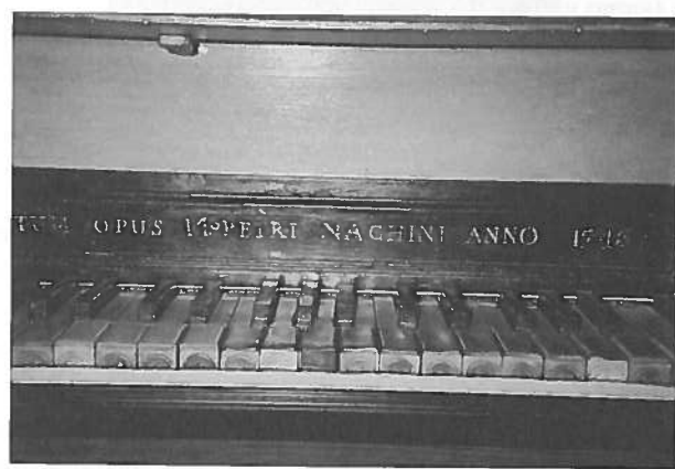
Tipke Nakićevih (Nacchinijevih) orgel v Bardu / Lusevera: i tasti dell'organo di Nacchini (Nakić)

Historične orgle italijanskega sloga pa žal »bivajo v diaspori«: svet se pač spreminja in današnja uporaba v okviru cerkvene glasbe jih ne zmore prav izkoristiti, saj dandanes z njimi v cerkvah povečini le nevsiljivo spremljamo ljudsko petje z nekaj preprostimi akordi, za katere včasih niti ni odločilno, ali jih pritisnemo tako ali malo drugače, pomembnejše je namreč petje, ki ga z igranjem podpremo. Se razumemo? Razlika v uporabi orgel je taka, kot če primerjamo Raffaelovo fresko in industrijsko tapeto: prva je namenjena ure dolgemu občudovanju in poglobljanju v umetniško in teološko-simbolično sporočilo, druga pa malce razbije monotono