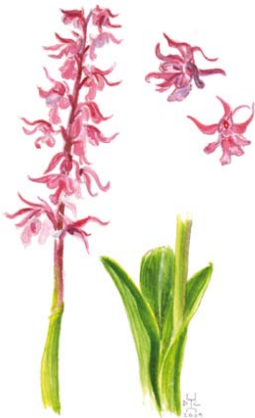
Acquerello su carta Akvarel na papirju