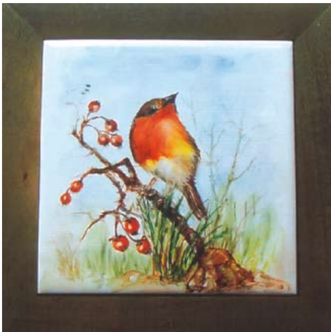
Lattesa - Pričakovanje Pittura su porcellana - barvanje na porcelanu