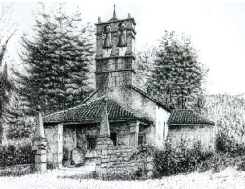
Chiesa di Biacis - China su carta Cerkev v Bijačah - tuš na papirju