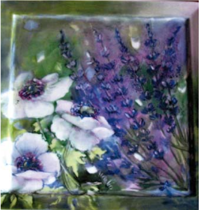
Frammenti di colori - Tecnica impressionista terzo fuoco Barvni drobci - Impresionistična tehnika trikratnega žganja