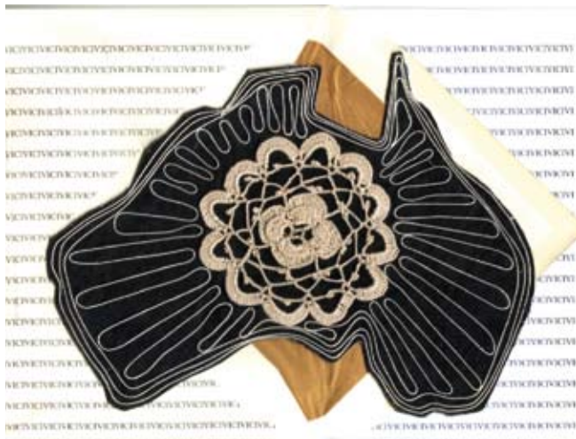
Terra Australis and linoleum - tecnica mista