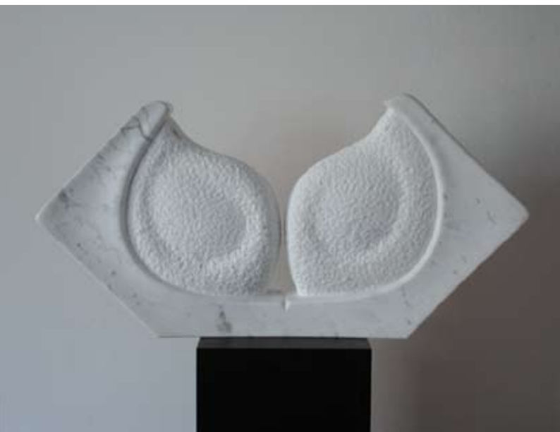
Kiss - Scultura in Marmo di Carrara Kip v marmorju iz Carrare