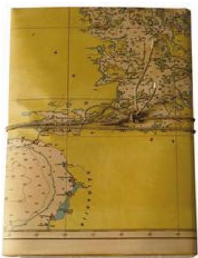
Libro d'Artista Umetniška knjiga