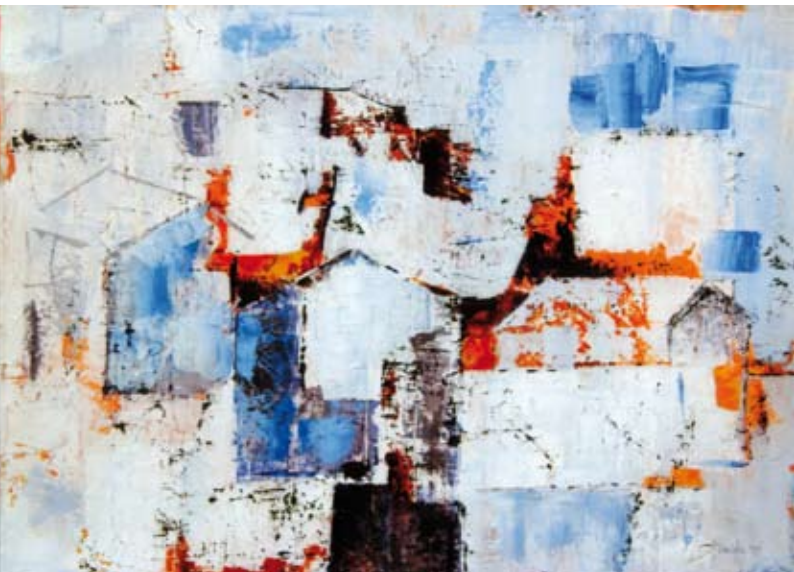
Trasparenze - tecnica mista su tavola