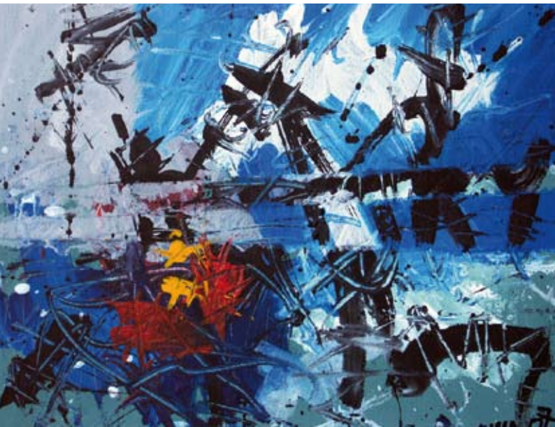
Autunno sul mare Jesen ob morju acrilico su tela