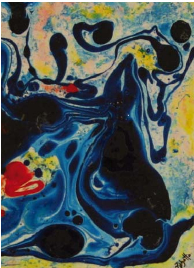
Caleidoscopio di sensazioni cromatiche - Tecnica mista Kaleidoskop kromatskih občutkov – Mešana tehnika