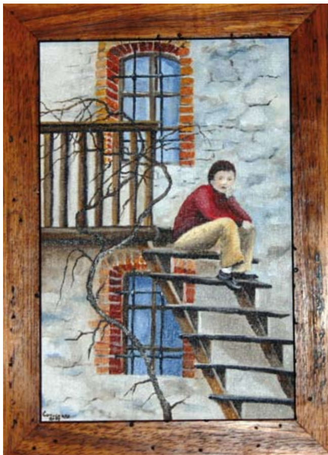
Istantanee di altri tempi - olio su tela cartonata Slike nekdanjih časov – olje na kaširanem platnu