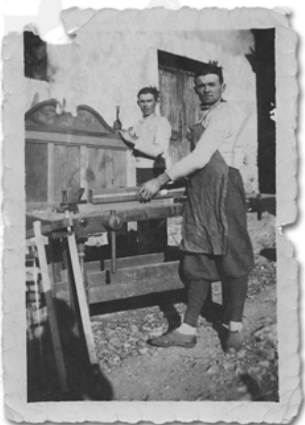
Genio an Perin Vukuovi (Seuce)